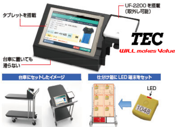
RFID対応ピッキングカートシステム